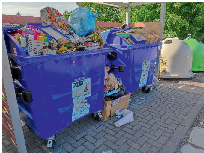
Nepořádek kolem kontejnerů u mostu do Malé Skalice.