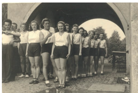
Okrskové cvičení 1947.

... ⇒ brigádnických hodin. V přízemí budovy se vybuchovaly nové šatny se sprchami. V roce 2011 proběhla nutná rekonstrukce sociálních zařízení. Začala příprava rekonstrukce budovy, shánění projektů, povolení, dotací. S pomocí daru města Česká Skalice, dotace MŠMT, Královéhradeckého kraje a župy Podkrkonošské-Jiráskovy se po velikém úsilí hlavně bratrů Vládi Fischera a Pavla Šrůtka vše povedlo v roce 2020. Nová střecha, okna, zateplená omítka, nová podlaha na malém sále, výmalba celé budovy. To vše se stihlo během roku, kdy byly tělocvičny zavřené kvůli covidové epidemii. Je stále co zlepšovat. Plánujeme mimo jiné úpravu prostranství před sokolovnou, nátěry dveří, opravu parket na velkém sále, nové osvětlení velkého sálu. To jsou všechno nákladné akce a jejich uskutečnění závisí na získání dotací, darů, sponzorů.