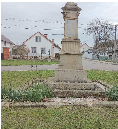
Křížek na Hurdálkově náměstí před opravou

Před Maloskalickou tvrzí stojí 3 m vysoká opravená socha sv. Jana Nepomuckého. Zrestaurovaná památka nyní upoutá oči mnohých ... ⇨