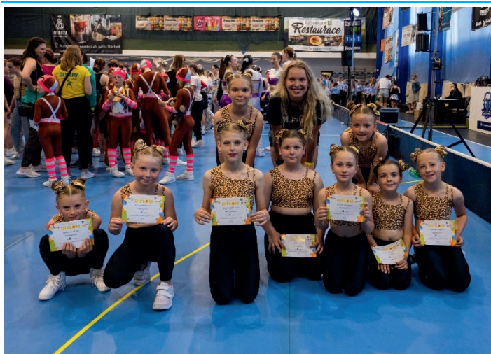
Nejmłodší tým a skladba Madagascar.