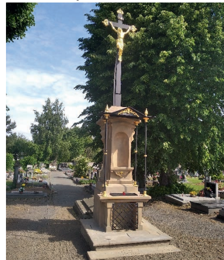
Centrální kříž na městském hřbitově po opravě.

ho středového pilíře, který je zdoben rostlinným motivem, vojenskými atributy, křížkem. Na středové části z čelní strany je vysekána plocha, do které je vysekán text: Vojínům padlým 1866. Pomník je nyní očištěn, okolo doplněn šterkem, zbývá dotmelení a natření hydrofobním nátěrem.