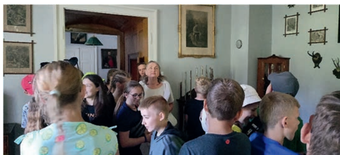
Na zámku Hrubý Rohozec.