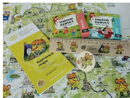
Cestovatelská hra s Toulavým baťohem.

A na jaké ceny se tentokrát můžete těšit? Tou hlavní je víkend strávený na farmě Wenet v Broumově včetně ubytování pro celou rodinu. Dále můžete vyhrát čtyřdenní rodinný pobyt v kempu Brodský s celodenním zapůjčením koloběžek, vstupenku pro dvě osoby do Bastionu I a podzemí v pevnosti Josefov včetně ubytování na jednu noc se snídaní