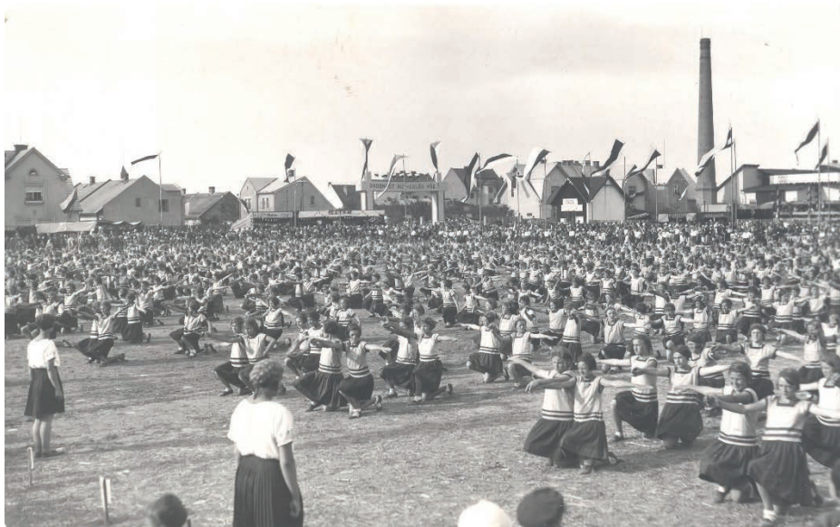
Župní cvičení v lokalitě Na Kamenci zřejmě v roce 1928.