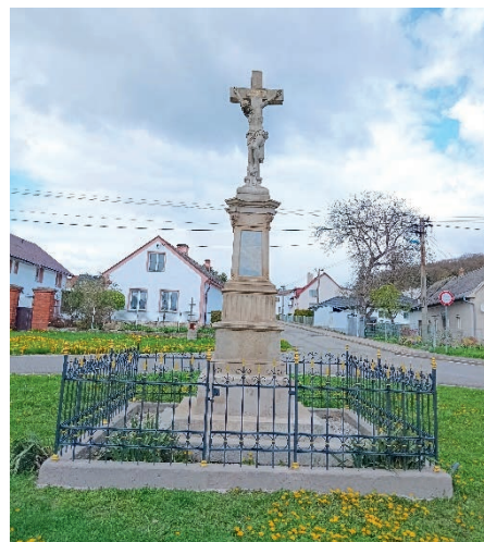
Křížek na Hurdálkově náměstí po opravě.