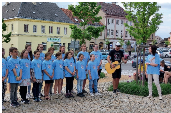
Pěvecký sbor Viktorka.

V týdnu od 26. do 30. 6. všichni žáci obdrželi svá vysvědčení.