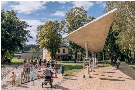
Malé Lázně Běloves.

Toulavý baťoh již deset let provází malé i velké turisty křížem krázem regionem Kladského pomezí. Každoročně je s putováním spojena i cestovatelská hra, o kterou nepřijdete ani letos. Tak hurá za zábavou na výlet!