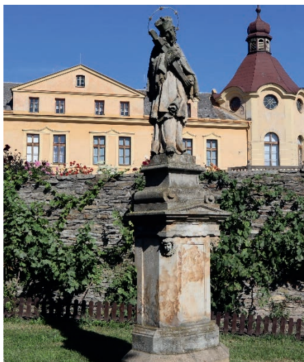
Sv. Jan Nepomucký u muzea před opravou a po opravě.

V ovocném sadu u městského hřbitova byl zrestaurován kříž s ukřížovaným Kristem na členitém pilíři. Památka byla omyta regulovanou tlakovou vodou za pomoci kartáčů a špachtlí. Kámen byl napuštěn biocidní látkou, která zamezí dalšímu růstu mechů a řas. Korodující armatury byly odstraněny a nahrazeny kovářsky opracovanou nerez ocelí. Bylo provedeno lokální zpevnění a rovněž provedeny plastické retuše a provedena drobná barevná retuš, vytažení písma slabou lazurou. Památka byla ošetřena hydrofobní látkou v horizontálních partiích. Kovový plůtek byl