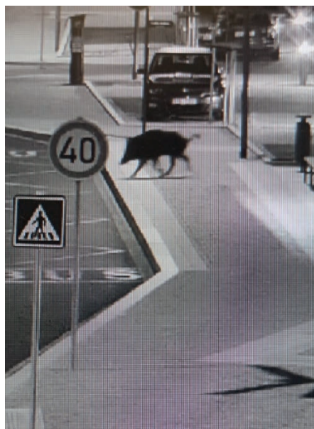
Divočák na kamerovém záznamu z Husova náměstí.

Dne 15. 5. 2023 oznamovala řidička strážníkům, že na obchva-