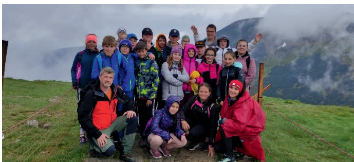
Výprava do Krkonoš.