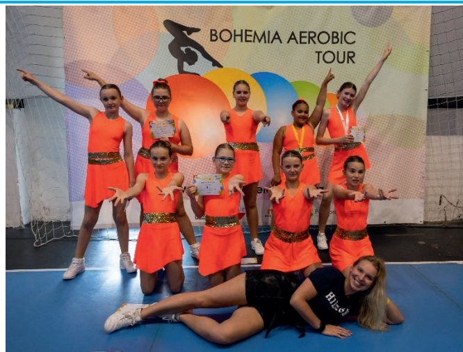
Soutěžní skladba Děti ráje.