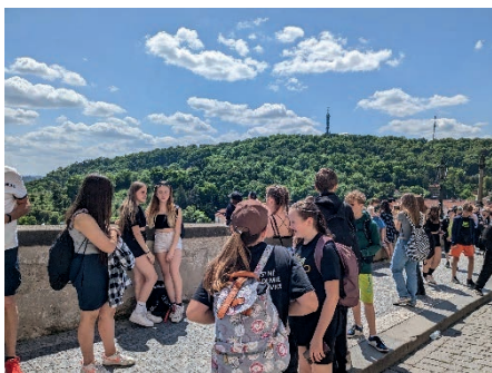
Na Karlově mostě.

... ⇒ roce budou rozhodovat, na kterou školu si podají přihlášku. V krásném prostředí školního zahradnictví v Pouchově byly pro žáky připraveny stánky, u kterých jim studenti všech oborů předávali zajímavou a praktickou formou veškeré informace. Žáci si mohli vyzkoušet barvení vlasů, pletení housek, písmomalířství, tetování, floristiku či si zahrát volejbal. Všichni účastníci z českoskalické školy si workshop velmi užili.