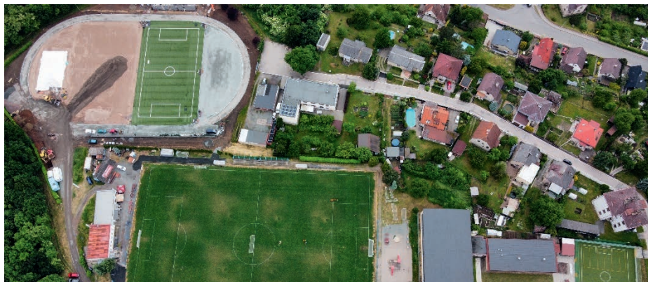
Sportovní areál Žižkův kopec.

Pokud navštívíte vojenský hřbitov , i tady probíhá obnova původního historického vzhledu. V červenci by měly být dokončeny mlatové cestičky a začnou práce na novém oplocení, které je tvořeno 33 ručně opracovanými pískovcovými sloupky s novými dřevěnými výplněmi.