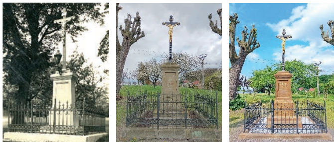
Křížek u hřbitova, historický snímek a záběry před a po opravě.

... ⇒ Skaličáků. Kámen byl napuštěn biocidní látkou a poté očištěn za pomoci regulované tlakové vody. Čep byl očištěn od koroze a spára zatmelena flexibilním tmelem. Chybějící modelace byla doplněna tmelem stejné barevnosti a frakce. Bylo provedeno zlacení svatozáře a barevná retuše. Kámen byl napuštěn biocidní látkou a posléze bylo provedeno hydrofobní ošetření.