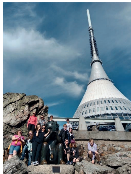
Na Ještědu.

Knihovnické minimum na 2. stupni se v letošním roce protáhlo až do května, kdy se vystřídaly všechny třídy. Vyučující 6.–8. ročníků vybírali z mnoha nabízených témat, které žákům na tělo připravila vedoucí knihovny-paní Kabelová. Děkujeme. 9. třídy si tradičně prohlédly místní knihařství.