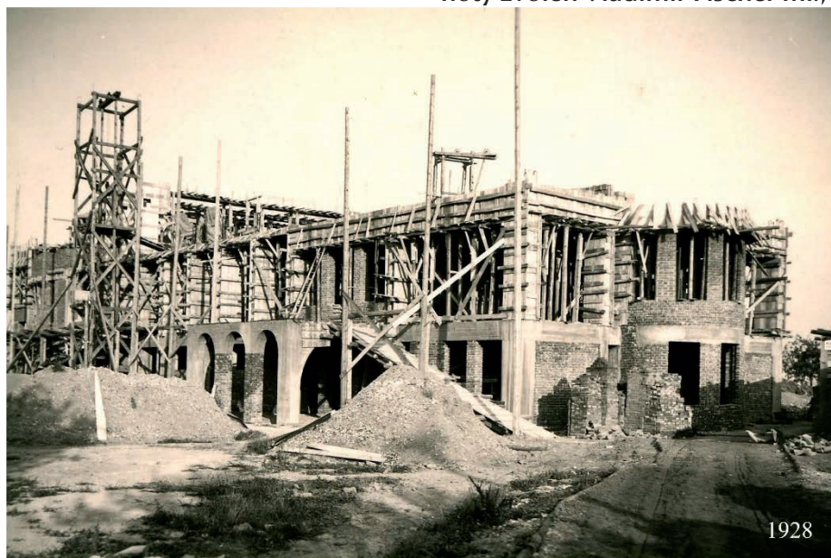
Stavba sokolovny v roce 1928.