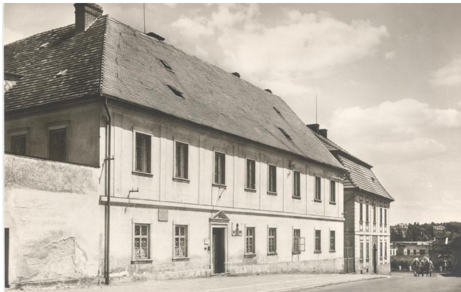
Budova bývalého Steidlerova hostince před rokem 1948.