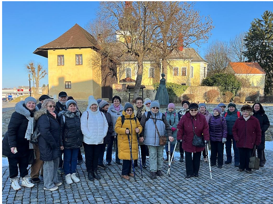
Společná fotografie člen SONS Náchod a Trutnov.

V roce 1341 byl českým sněmem uznán za budoucího panovníka. Od 40. let je považován za favorita na císaře římskoněmecké