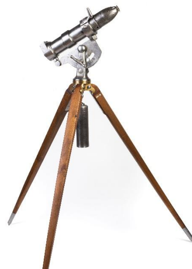
Replika čtyřliberního raketometu vz. 1865 s nasazenou granátovou rotační raketou (raketomet není součástí sbírek Muzea B. Němcové)

Do bitvy u České Skalice se raketová děla nezapojila, jejich nasazení následovalo až o den později, 29. června 1866, při srážce u Sviništan. Zde do bojů zasáhla 11. raketová baterie z polního dělostřeleckého pluku č. 4. Při ostřelování Sebuče od Čáslavek bylo vystřeleno celkem 63 raket, z nichž některé selhaly a neexplodovaly. Právě z tohoto bojiště pravděpodobně pocházejí naše dochované exempláře.