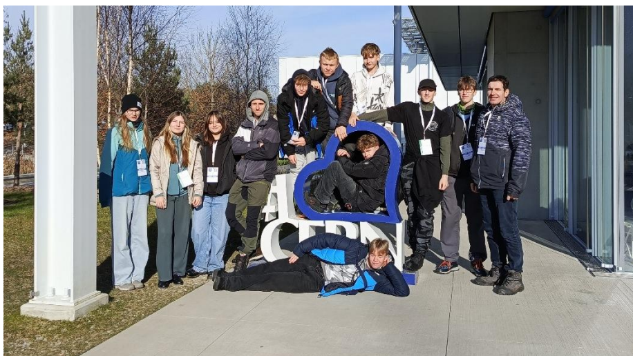
Žáci ZŠ Česká Skalice ve švýcarském Lausanne.

Nejen fyzikou však živ je člověk, takže zbylo i dost času na návštěvu dalších zajímavých míst, interaktivní science centrum Technorama, Muzeum komunikace v Bernu, sídlo OSN v Ženevě, Dopravní muzeum v Lucernu, Přírodovědné muzeum Univerzity v Curychu nebo největší evropské vodopády na Rýnu u města Schaffhausen.