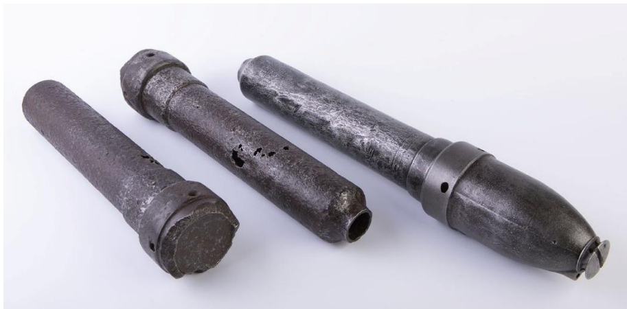
Rakousko: čtyřliberní granátová rotační raketa vz. 1865 (inv. č. M-2000-379) a trubice hnacích motorů (inv. č. M-2024-025, M-2024-026)