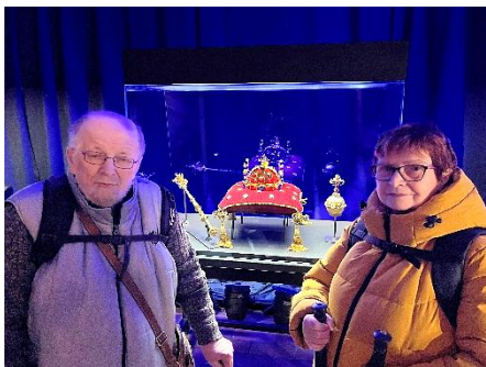
Návštěva výstavy „Korunovační klenoty na dosah“.

Tuto výstavu navštívili v hojném počtu členové poboček SONS Náchod a Trutnov (Sjednocená organizace nevidomých a slabozrakých).