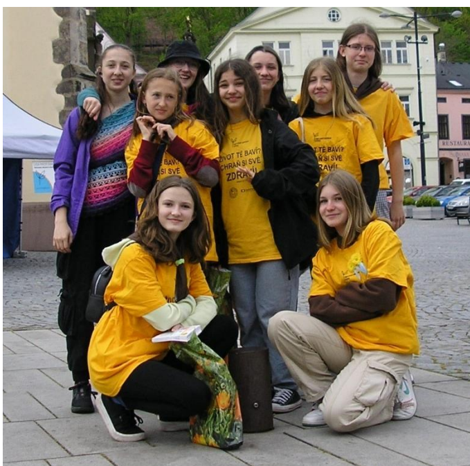
Květinový den 14. 5. 2025.

Každý začátek kalendářního roku je vhodnou příležitostí k ohlédnutí za tím uplynulým. Také náchodská pobočka Ligy proti rakovině bilancuje svoji činnost.