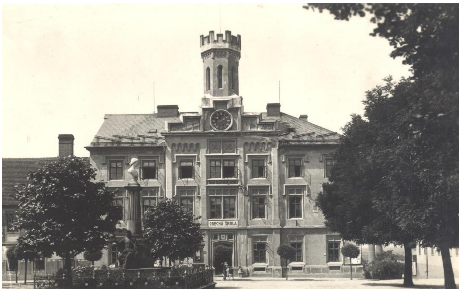
Budova staré radnice a obecné školy na Husově náměstí.

Pohled do historie českoskalického školství aneb Kde se vzdělávala českoskalická mládež.