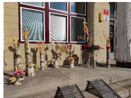
Velikonoční výzdoba města.