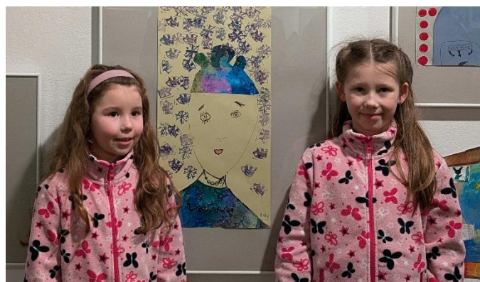
Výtvarnice na předávání ocenění v GVUN.