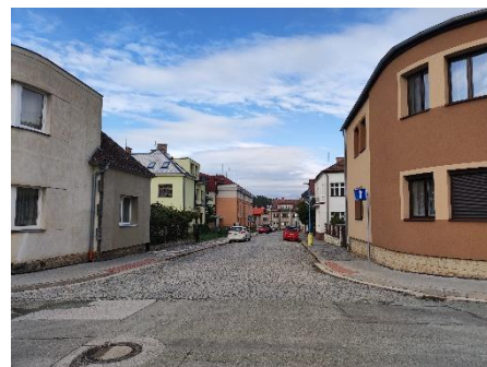
Pohled do ulice Komenského.

Současne pokračujeme v dalších investičních projektech, součástí je zhotovitelé 3. etapy revitalizace Husova náměstí , připravujeme výběrové řízení na zho-