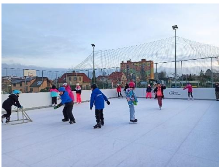
Bruslení žáků 4. tříd.