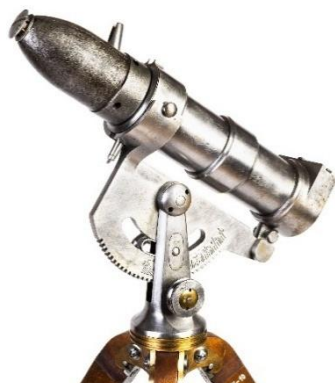
Detail umístění rakety v raketometu.

V bojových podmínkách se nejčastěji používaly čtyřliberní granátové rakety. Jejich hnací motor byl zhotoven ze železného plechu a měl délku 31,6 cm při vnějším průměru 5,7 cm. Na jeho zadním konci se nacházela hlavní tryska, kterou během letu unikaly spaliny. Přední část motoru byla zesílena železným prstencem opatřeným závitem pro našroubování do dna střely. Litinová hlavice o průměru 7,7 cm a délce 15,4 cm obsahovala 90 g střelného prachu. Rakety byly vybaveny stejným typem konkusního zapalovače, jaký se používal u čtyř a osmiliberních granátů polních děl vz. 1863. Princip rotační stabilizace spočíval v tom, že spálené plyny unikaly kromě hlavní trysky i čtyřmi výstupními tryskami na dně hlavice v šikmém směru, čímž se dosáhlo otáčení rakety kolem podélné osy a zároveň její stabilizace během letu. Výbuch vytvářel až 50 střepin se smrtícím