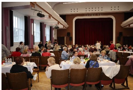
Město nejen ženám.

humorem, nadhledem a bohatými zkušenostmi potěší a pobaví všechny přítomné. Řekla bych, že touto akcí odstartujeme letošní kulturní „maratón“. Věřím, že si v nabitém kalendáři různých akcí najdete tu svou. Začínáme rovněž s výlety, které jsou podpořeny dotačně.