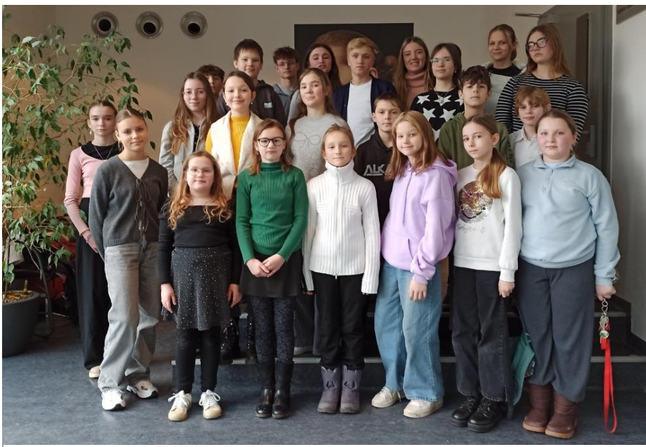
Účastníci koncertu ve foyer královéhradecké filharmonie.