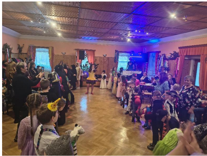
Plný sál tanečníků a masek.