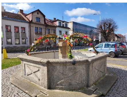
Loňská velikonoční výzdoba.

Všechny tyto organizace jsou součástí města a jsou financovány z jednoho společného rozpočtu. Právě proto vnímám tuto spolupráci jako smysluplnou, potřebnou a přínosnou pro celé město i jeho obyvatele.